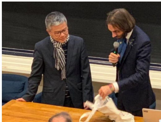
GS Ngô Bảo Châu và nhà Toán học Cédric Villani 3 .

Giải thưởng năm 2016 được tổ chức vào ngày 12 tháng 12 năm 2018 2 , trao tặng cho nhà Toán học NGÔ BẢO CHÂU (Pháp gốc Việt) tại Paris. Chủ tịch hội đồng xét duyệt là nhà Toán học Cédric Villani (Huy chương Fields 2010).